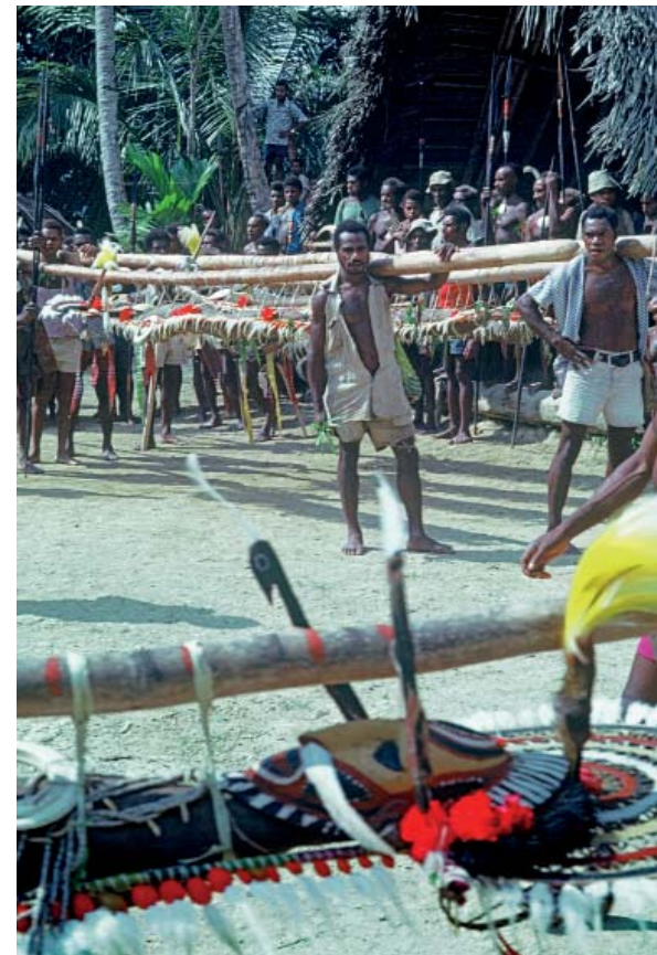
Abb. 5 Die mit Masken und geflochtenem Hinterhauptrad geschmückten Prachtexemplare von langem Yams gebunden, an Bambusstangen gebunden, zum Wettbewerb auf den Festplatz getragen. Dorf Lonem. Foto: Brigitta Hauser-Schäublin, 1980.

Die Farben und Farbkombinationen bilden ein System. Die Farbenpraxis der Abelam besitzt, wie ich zu zeigen versucht habe, eine kulturimmanente Logik und Sinnhaftigkeit, die weder mit europäischen Farbenlehren erklärt, geschweige denn verstanden werden kann. Die Farbenpraxis und die Grundregeln ihrer Kombination und Formbildung sind zentraler Teil der Abelam-Ästhetik und eingebettet in umfassende Sinnzusammenhänge.