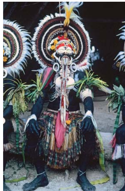
Abb. 4 rechts Kulttänzer nach einer Initiation: Sein ganzer Körper wurde zuerst schwarz bemalt und dann mit Schmuck aus verschiedensten Materialien dekoriert. Die Augenpartie ist vollständig mit Farbe bedeckt; er darf die Augen nicht öffnen. Zwischen den Zähnen hält er einen Eberhauerschmuck als Symbol der Wehrhaftigkeit. Dorf Lonem. Foto: Brigitta Hauser-Schäublin, 1980.

Grundierung auch als erster Schritt in der Verwandlung des natürlichen Untergrundes in ein sakrales Bildwerk verstanden. Der Hauptkünstler – als Leiter eines ganzen Malerteams – beginnt an der Spitze des auf dem Boden ausgelegten Giebeldreiecks die erste Linie mit einer Vogelfeder zu ziehen, die er in weiße Farbe getaucht hat. Die weiße Farbe ist die formbildende Farbe; sie hat den Vorrang vor allen anderen Farben, weshalb sie dem Meisterkünstler vorbehalten ist. Eine Grobeinteilung der Giebelwand in verschiedene Abschnitte für die jeweils horizontal verlaufenden Musterbänder nimmt er nicht vor. Er malt sukzessive die Umrisse der Motive wie Wirbel, pflanzliche und tierische Elemente, Figuren mit angewinkelten Armen und Beinen, Körper, Gesichter mit dreieckigen flachen Kopfaufsätzen und weißen Federbändern sowie Netztaschen als Attribute der Figuren.