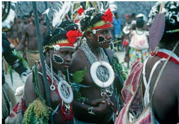
Abb. 3 links Geschmückte junge Frauen mit Gesichtsbemalung; sie begleiten ihre Brüder bei einem Kultanz. Dorf Lonem. Foto: Brigitta Hauser-Schäublin, 1980.

Die Giebelwand für ein Kulthaus ist maßgeschneidert; ihre Größe richtet sich nach den Dimensionen des Gebäudes. Sie wird aus zusammengenähten unteren Teilen von Sagopalmwedeln gefertigt. Die fast spiegelglatte Oberfläche dieser flachgedrückt Palmwedel wird als erstes Stück für Stück und von oben nach unten mit dunkelgrauer oder schwarzer Erdfarbe grundiert. Damit wird ein Untergrund geschaffen, auf dem die Erdfarben haften. Gleichzeitig wird die