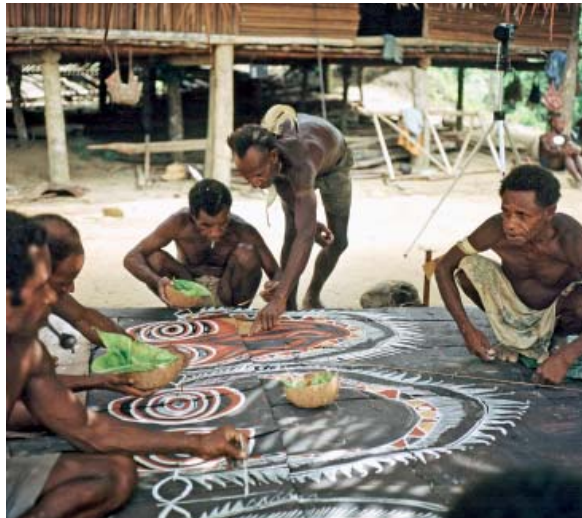
Abb. 2 Bemalen einer Kult- hausfassade. Der Meistermaler erklärt einem Helfer, wo und wie er gelbe Farbe auftragen muss. Im Vordergrund: Ein weiterer Helfer füllt weiße Dreiecke aus, während sein Kollege mit Baumharz die schwarzen Ringe der konzent- risch angelegten Augen ausfüllt. Dorf Kalabu. Foto: Jörg Hauser, 1980.

Doch nun zu den Prinzipien der Abelam-Malereien. Ich werde einige der skizzierten Punkte der europäisch-westlichen Farbenlehren aus der Perspektive der Abelam diskutieren: das Konzept der Nicht-Farben, die Idee der einander gleichgestellten Grundfarben und der Mischfarben (Sekundär- und Tertiärfarben), die Kombination der Farben miteinander und das Verhältnis von Farbe und Form. Ein weiterer, besonders wichtiger Punkt betrifft die Beziehung zwischen der äußeren und der inneren Dimension der Farben, wie Kandinsky dies nannte, also Fragen nach Assoziationen, Empfindungen und Bedeutungen.